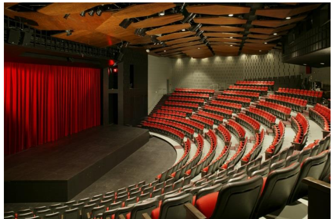
L'auditorium du Théâtre Centennial avec son ascenseur en position élevée.

Le Théâtre Centennial dispose d'un ascenseur de scène pouvant prolonger l'espace scénique au besoin. Noter que l'ascenseur de scène ne peut ni monter ni descendre durant le cours d'une représentation.